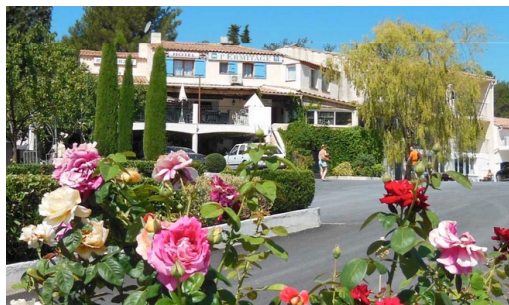
Hôtel l'Ermitage – Les Salles sur Verdon